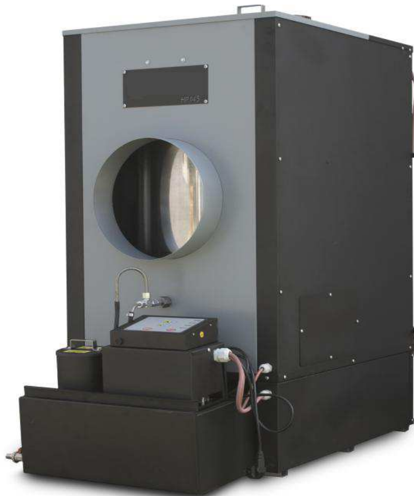
INTERLOOP HP - 145R